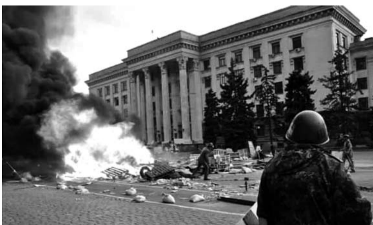
Nuotraukoje iš interneto – akimirka prieš kylant žudikiškam gaisrui Profsajungų rūmuose.