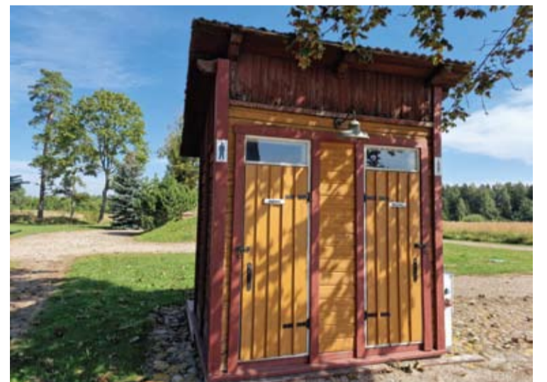
Naudojimas Surdegio geležinkelio stoties lauko tualetu gali būti laikomas provokacija. Šiuo metu jau kaba spynos.

Prie Surdegio geležinkelio stoties esantys lauko tualetai, regis, nėra muziejinis ekspozicija.