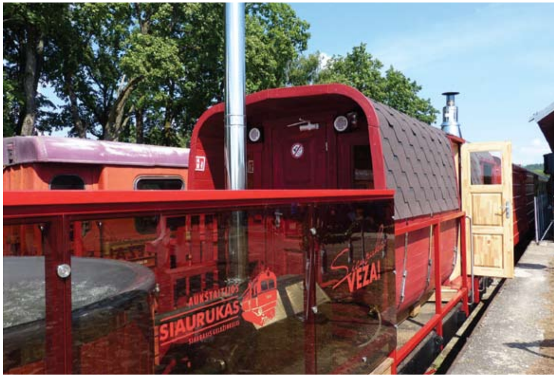
Rugpjūčio mėnesį VŠĮ „Aukštaitijos siaurasis geležinkelis“ pradėjo teikti naują unikalią vagono-pirties paslaugą.