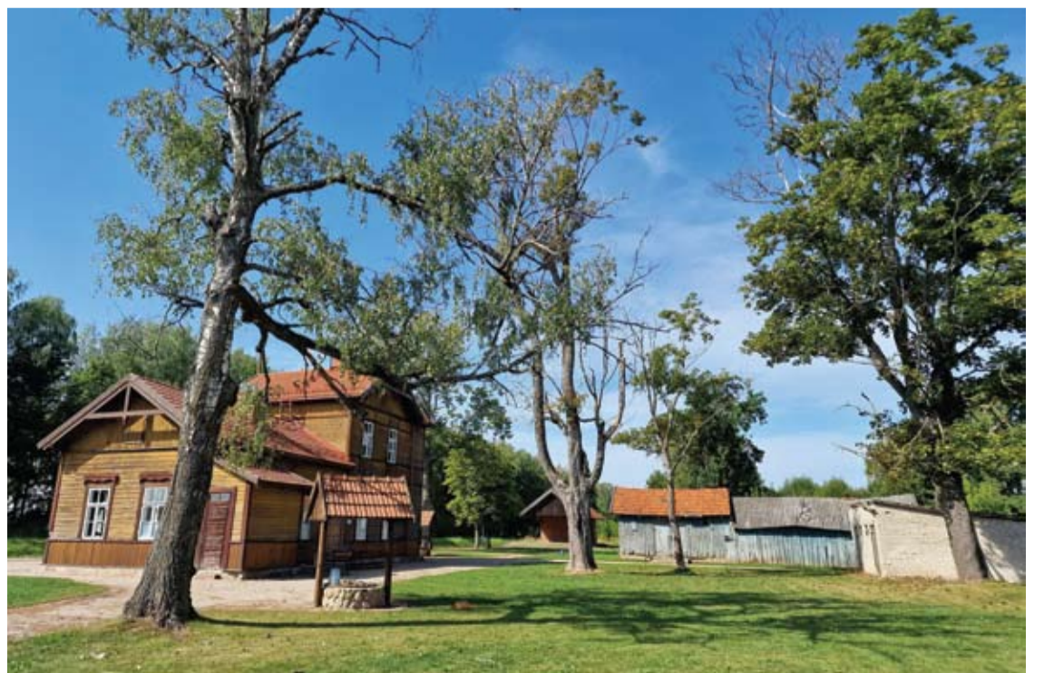
Surdegio geležinkelio stotis pastatyta XIX amžiaus pabaigoje.

natas - stovi paprasta būdelė su dvejomis durimis. Vienoj pusėj kabo vyro atvaizdas, kitoj - moters, dar ir ant durų užrašyta - „Vyrams“ bei „Moterims“. Pats žiemą stoties lauko tualete buvau, ir, kaip dabar paaiškėjo, taip pat atlikau neteisėtus veiksmus.